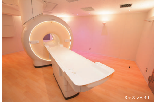
3 テスラ MRI

検査終了後は、堂島川を臨む 5 階カフェテリアで休憩していただくことができます。アーバンリゾートを思わせる見晴らしのよい空間でゆったりとした時間をお過ごしください。 また、近隣店舗でご利用いただけるお食事券（1,500 円分）をお渡ししています。ランチ・ディナー共にご利用いただくことができます。