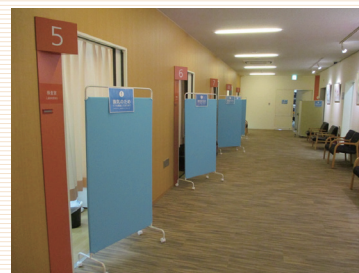
検査室入口にパーテーションを設置しております

待合の椅子やテーブル、ドアノブ等、皆様の手が触れる部分は定期的にアルコール消毒を行っております。