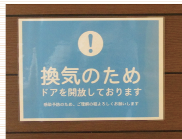
ドアを開放し換気をしております

開放できるドア、窓は開け、外気を取り入れ空気を循環させております。 また、一部の検査室や診察、結果説明室のドアを開放しております。 入口へのパーテーションの設置など、対応策を実施しております。