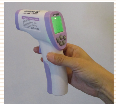
非接触式体温計にて検温を行います

スタッフから受診者様への飛沫感染が起こらないよう、受付に保護用の透明シートを設置しております。